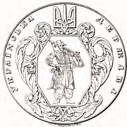
Велика печатка Української держави (1918).