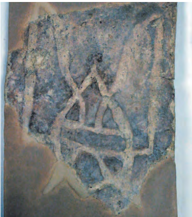
Зображення Тризуба князя Володимира Святославича (кін. X — початок XI ст.), Київ, територія Десятинної церкви.