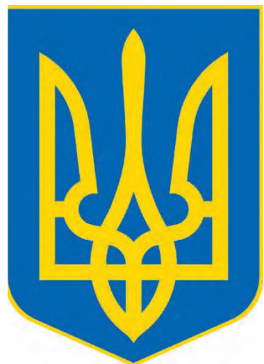
Сучасний герб України (1992).