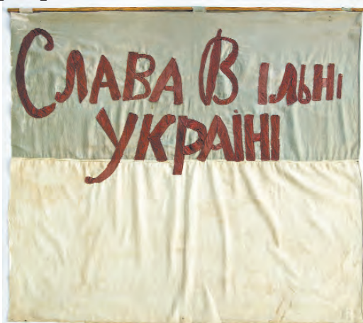
Прапор «Слава вільній Україні» (1918). Оригінал зберігається в НМІУ.