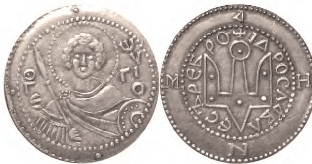
Срібник Володимира Святославича (кін. X — поч. XI ст.).