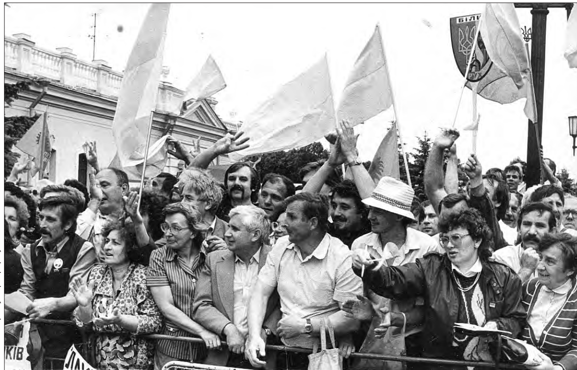
16 липня 1990 року. Мітинг біля Верховної Ради України під час прийняття Декларації про суверенітет.

Володимир Гриньов, який також входив до складу комісії, був відомим політичним діячем, активно працював над економічними розділами Декларації.