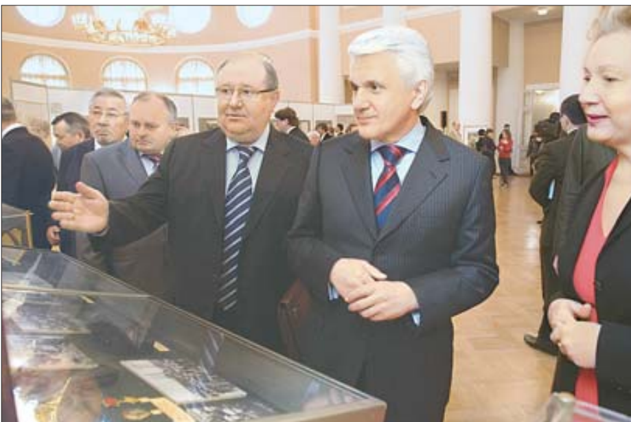
7 квітня. Росія. Під час триденного візиту до Санкт-Петербурга Голова Верховної Ради України Володимир Литвин оглянув виставку «65 років Перемоги у Великій Вітчизняній війні», яку презентовано у рамках Міжнародної парламентської конференції, присвяченої цій темі.