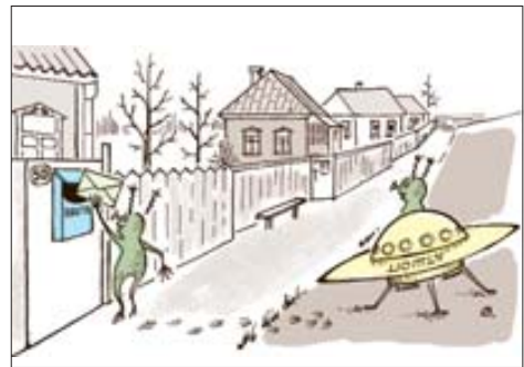
Від чергового: — До речі, після Аделаджи нам що тимурівський рух, що адвентисти сьомого дня — все єдино...