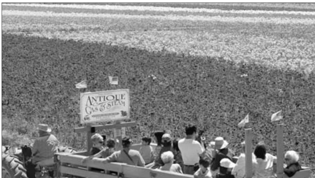
Щовесні тисячі туристів приїжджають в американське містечко Карлсбад (штат Каліфорнія), щоб насолодитися красою квітучого поля, вкритого «килимом» із азійських жовтців.