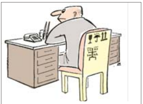
Від чергового: — Ваше красномовство наводить на думку про те, що марксисты мали рацію: релігія таки опіум для народу.

— Сьогодні світле свято Благовіщення. Указ Президента — також блага звістка!