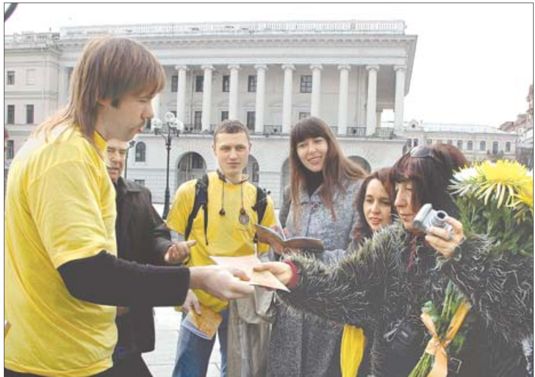
5 квітня. Під час акції на столичному Майдані Незалежності, присвяченій 300-річчю Конституції України гетьмана Пилипа Орлика, всі охочі могли отримати екземпляр Конституції.