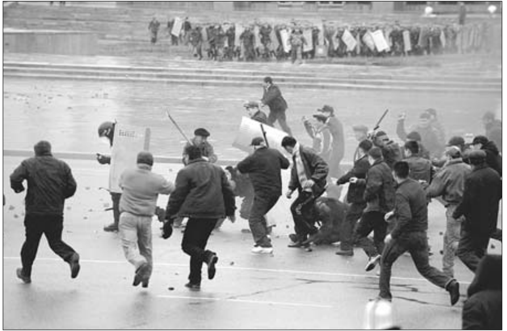
Заворушення на вулицях Бішкека 7 квітня.

Учорашня влада країни не здається й сьогодні. Так, президент Киргизії Курманбек Бакієв спростував розповсюджене раніше повідомлення про його відставку. Він нині перебуває на півдні країни в Джелал-Абаді, де його ще підтримує