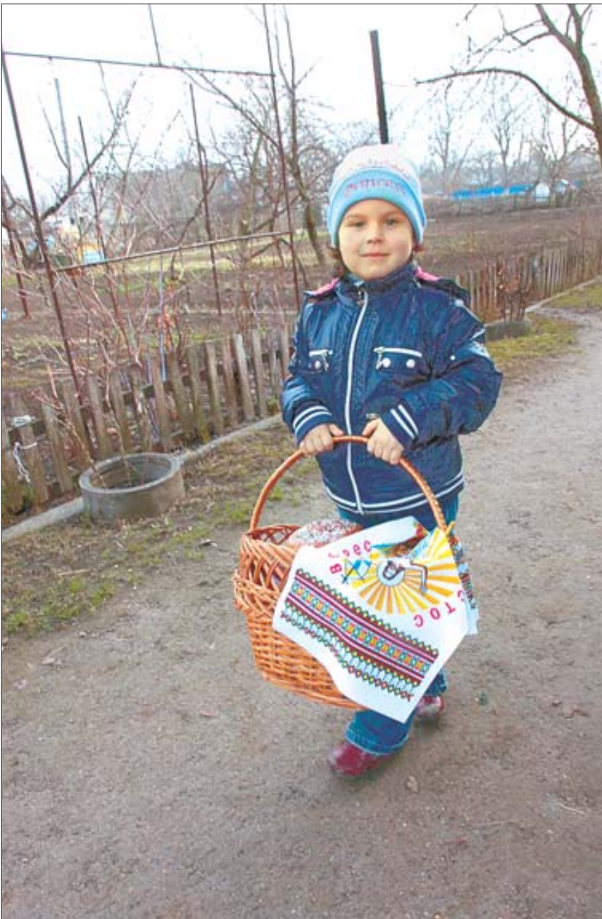
4 квітня. Хмельницька область, Кантівка. Святкування Великодня.