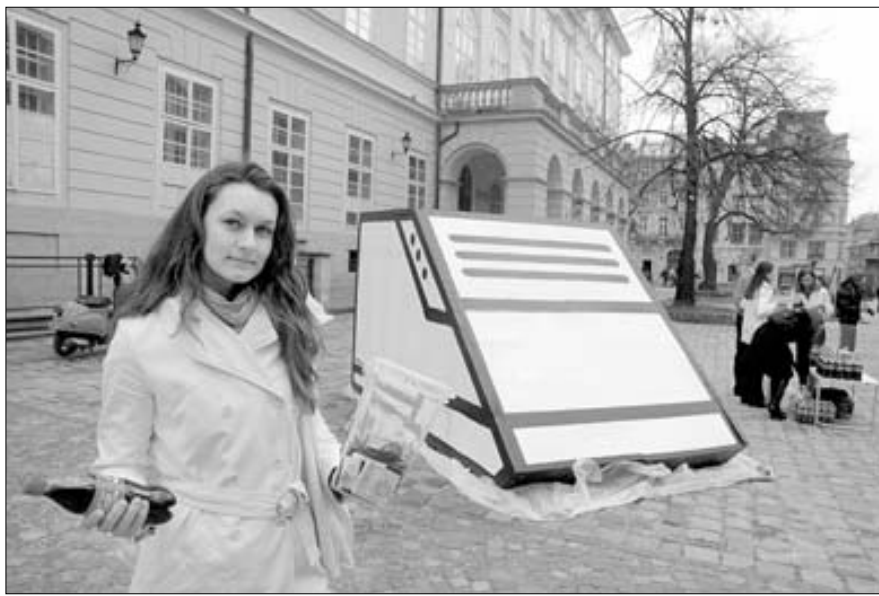
У Львові в рамках благодійної акції розмалювали величезний кросівок — бажаччі змогли приєднатися, кинувши до скриньки волонтера кошти для реабілітаційного центру «Ромашка», а людина, яка розщедрилася більш як на шість гривень, одержувала в подарунок пляшку «Кока-коли».