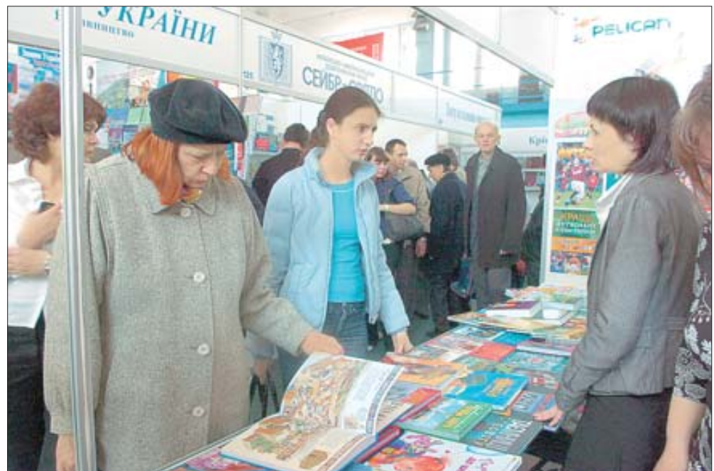
8 квітня. Київ. В Весняний книжковий ярмарок-фестиваль «Книжковий світ».