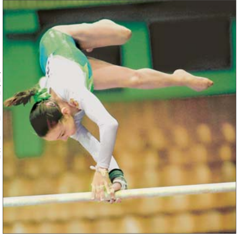
3 квітня. У столичному Палаці спорту відбувся IX міжнародний турнір зі спортивної гімнастики на «Кубок Стелли Захарової».