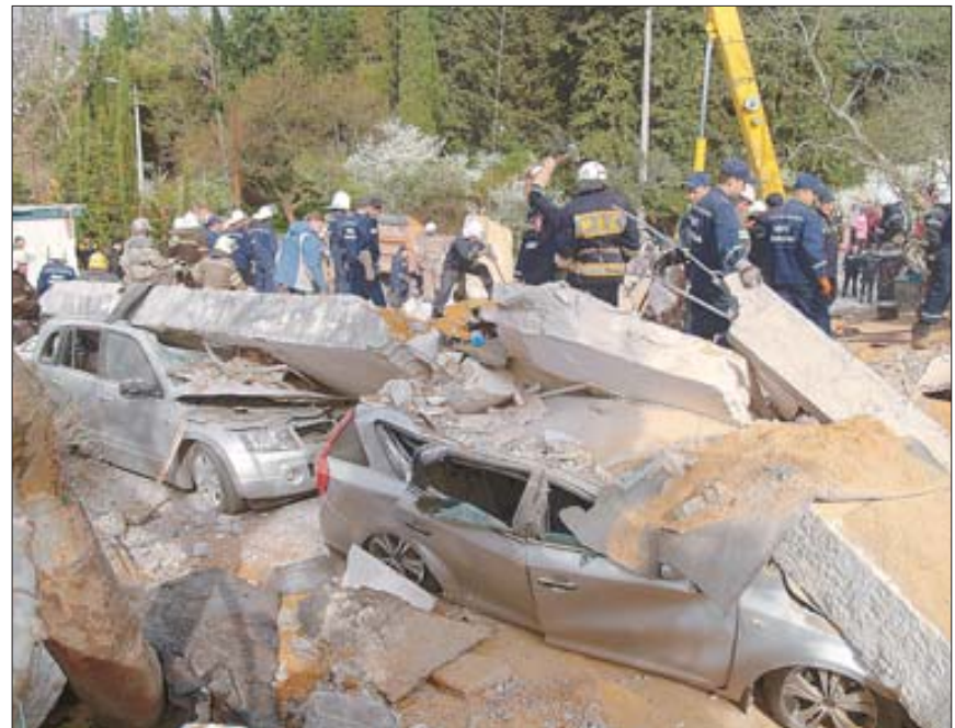
6 квітня. Крим, Ялта. Співробітники МНС розбирають завали на місці вибуху в одноповерховій будівлі операторської із запуску насосів чистої води Кримського республіканського підприємства водоканалізаційного господарства Південного берега Криму.