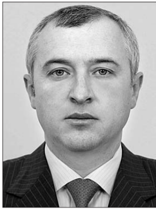
Перший заступник Голови Верховної Ради України Ігор Калетнік.