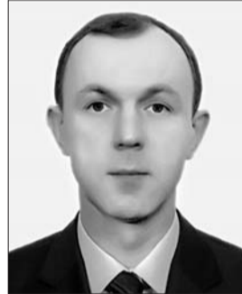
Голова Комітету з питань законодавчого забезпечення правоохоронної діяльності Андрій Кожем'як.