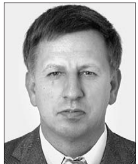
Голова Комітету з питань Регламенту, депутатської етики та забезпечення діяльності Верховної Ради України Володимир Макешко.