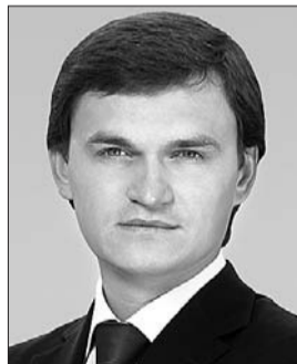
Голова Комітету з питань правової політики Валерій Писаренко.