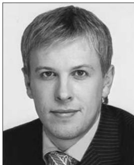
Голова Комітету з питань податкової та митної політики Віталій Хомутиннік.