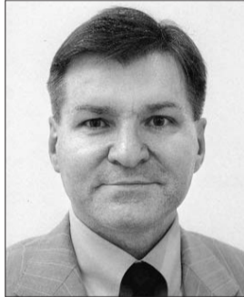
Голова Комітету з питань європейської інтеграції Григорій Немиря.