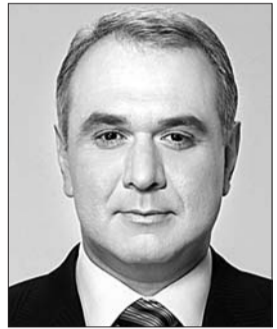
Голова Комітету з питань державного будівництва та місцевого самоврядування Давид Жванія.