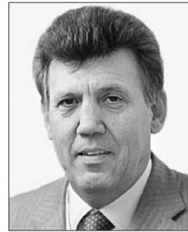
Голова Комітету з питань верховенства права та правосуддя Сергій Ківалов.