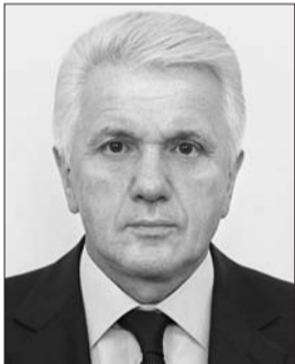
Голова Комітету з питань національної безпеки і оборони Володимир Литвин.