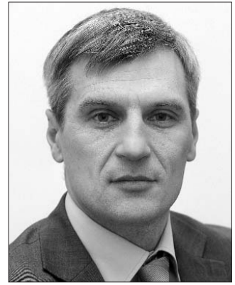
Заступник Голови Верховної Ради України Руслан Кошулинський.