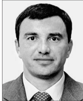
Голова Комітету з питань економічної політики Андрій Іванчук.