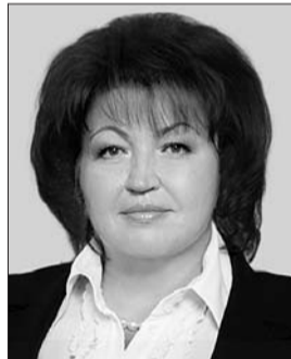
Голова Комітету з питань охорони здоров'я Тетяна Бахтєсва.