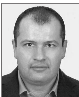
Голова Комітету з питань сім'ї, молодіжної політики, спорту та туризму Артур Палатний.