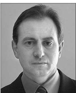
Голова Комітету з питань свободи слова та інформації Микола Томенко.