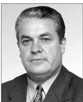
Голова Комітету з питань соціальної політики та праці Петро Цибенко.