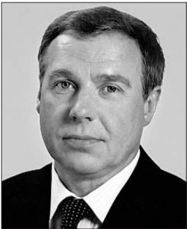
Голова Комітету з питань аграрної політики та земельних відносин Григорій Калетнік.