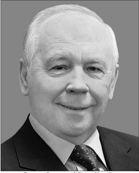
Голова Верховної Ради України Володимир Рибак.