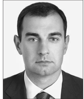
Голова Комітету з питань інформатизації та інформаційних технологій Валерій Омельченко.