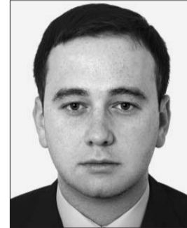
Голова Комітету з питань у закордонних справах Віталій Калужний.