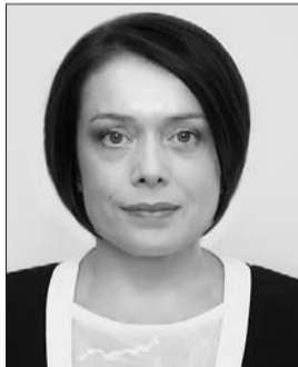
Голова Комітету з питань науки і освіти Лілія Гриневич.