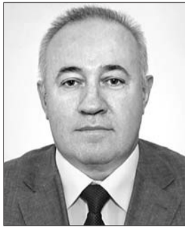
Голова Комітету з питань боротьби з організованою злочинністю і корупцією Віктор Чумак.