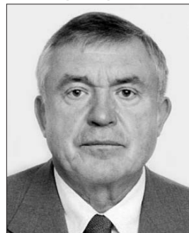
Голова Комітету з питань фінансів і банківської діяльності Олександр Риженок.