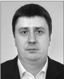
Голова Комітету з питань культури і духовності Вячеслав Кириленко.