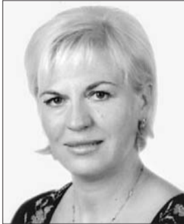
Голова Комітету з питань екологічної політики, природокористування та ліквідації наслідків Чорнобильської катастрофи Ірина Сех.