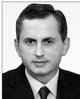
Голова Комітету з питань транспорту і зв'язку Борис Колесніков.