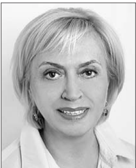
Голова Комітету з питань підприємництва, регуляторної та антимонопольної політики Олександра Кужель.